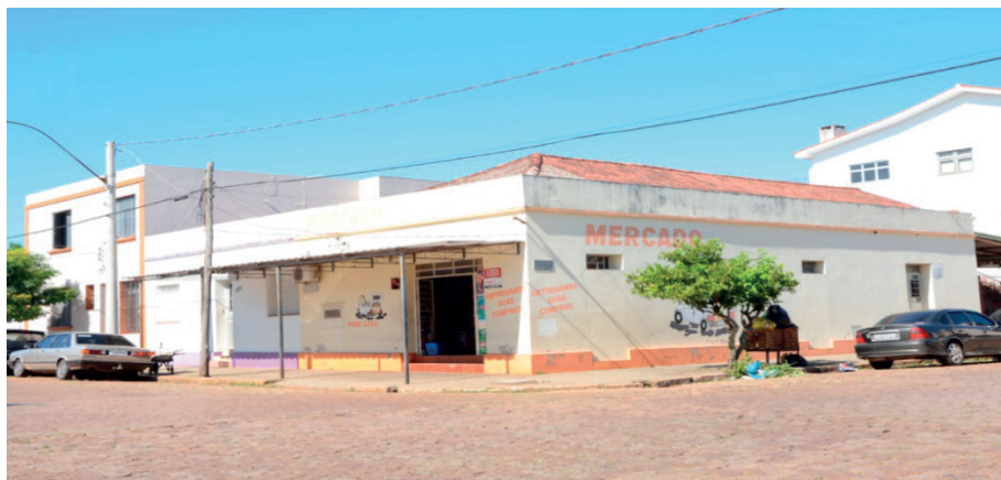
Imóvel adquirido em 1929 (loja). Muito descaracterizado.

que mudou o endereço da loja ocupando amplas e modernas instalações na esquina das Ruas Sete de Setembro com Plácido Gonçalves. O imóvel, símbolo de Tranquillo, está em pé até hoje, descaracterizado é bem verdade, mas ele preferiu vendê-lo a demoli-lo, para continuar desfrutando até o fim de seus dias.