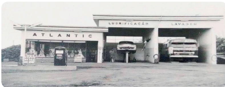
Posto inaugurado em 1960.