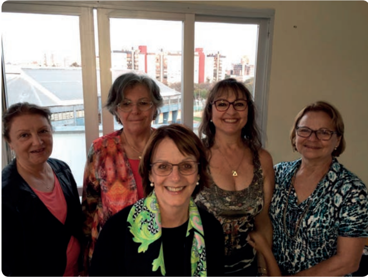
Fanita e suas cunhadas