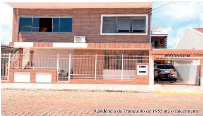
Residência de Tranquillo de 1955 até o falecimento