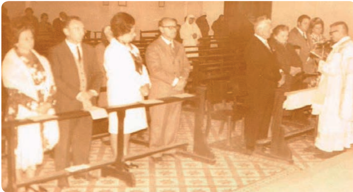
Bodas de Ouro