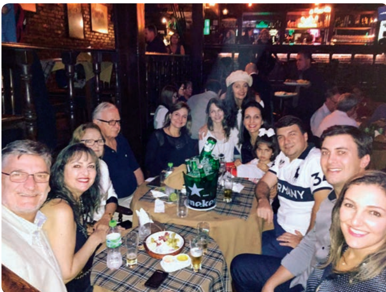
Família parcial da Anita