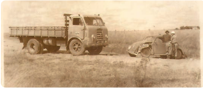
Foto do caminhão