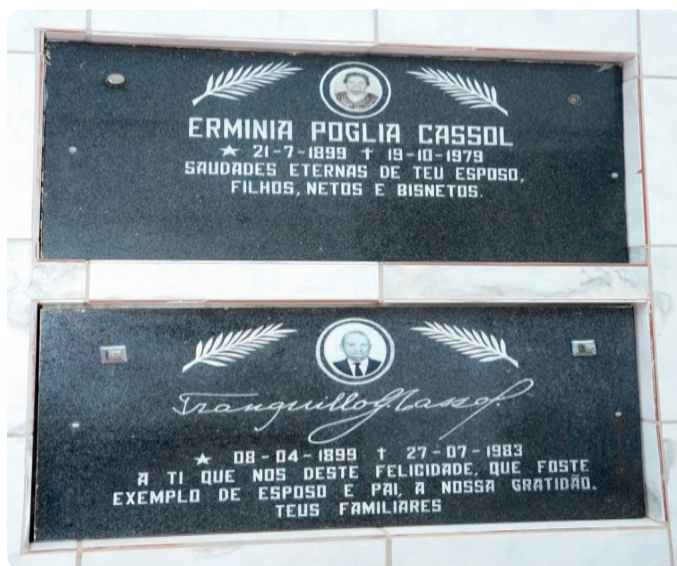
Placas no cemitério