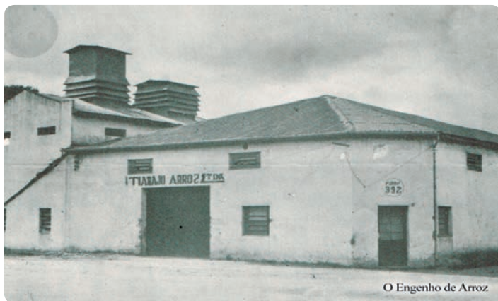
O Engenho de arroz

Tranquillo e Calixto desfizeram a sociedade, cabendo ao primeiro o engenho de arroz, e a Calixto o moinho de trigo. Neri, tendo outras atividades, declinou da direção compartilhada com Sérgio, e a este arrendou sua parte. Em 1978 o engenho voltou a ser de Calixto após compra do imobilizado.