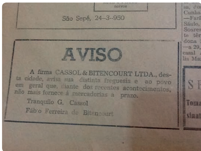
Anuncio no jornal