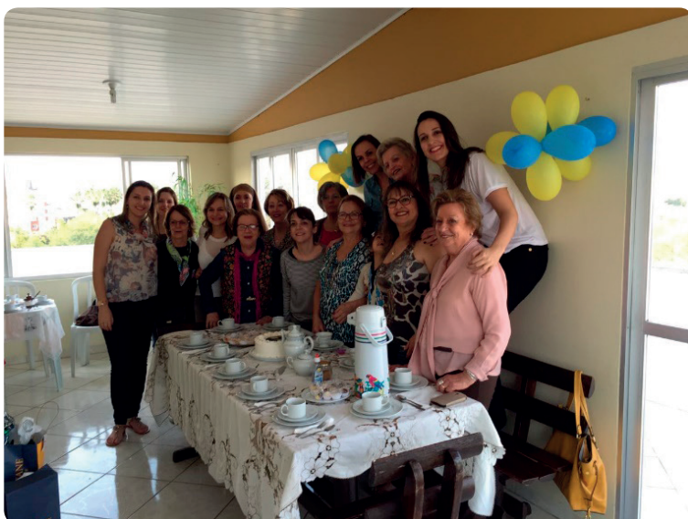
Chá de aniversário