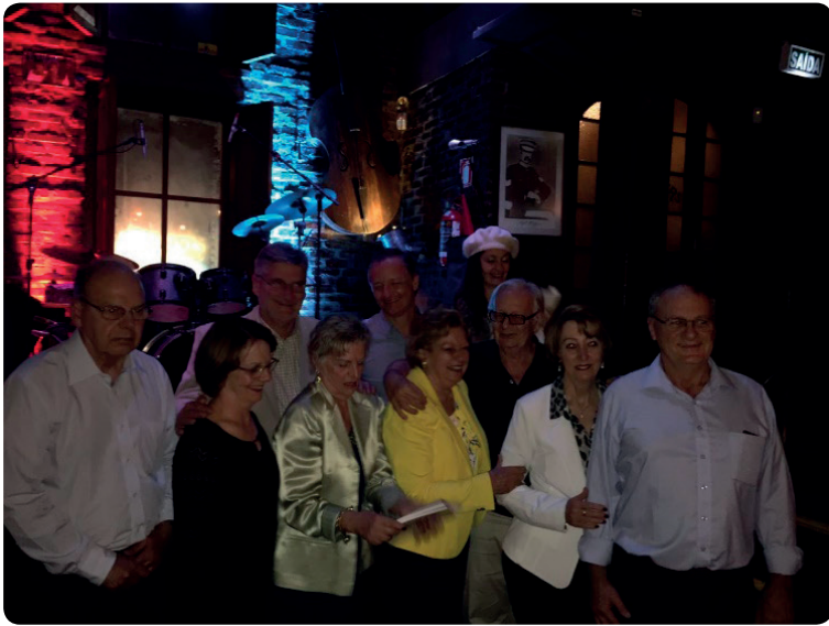
A tia e os netos