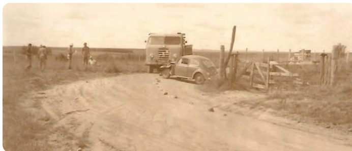
Foto do caminhão