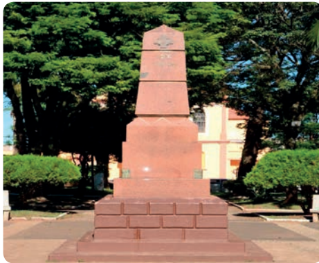
Monumento comemorativo do 1º centenário da colonização de São Sepé, em 1930.

O comércio prosperou dando-lhe a possibilidade de adquirir um imóvel mais amplo, mais central, ampliando-lhe, também, a oportunidade de crescimento econômico e social. Quando das comemorações do centenário do início do povoamento de São Sepé, Tranquillo já estava em novas instalações, situada na esquina, hoje, Av. Sete de Setembro com a Rua Osvaldo Aranha. A revista impressa, em comemoração a esta data, exibe a foto de uma loja bem provida, com proprietários satisfeitos e uma família feliz, estampado na face dos pais junto às suas filhas Anita, com 8 anos, e Julieta com 5 anos. Essa rápida evolução social e patrimonial lhe rendeu o convite para fazer parte da Comissão para construção do monumento, na praça central da cidade, que celebra o 1º centenário do início do povoamento, onde, no terreno que seria para a construção da capela, foi erguida uma cruz.