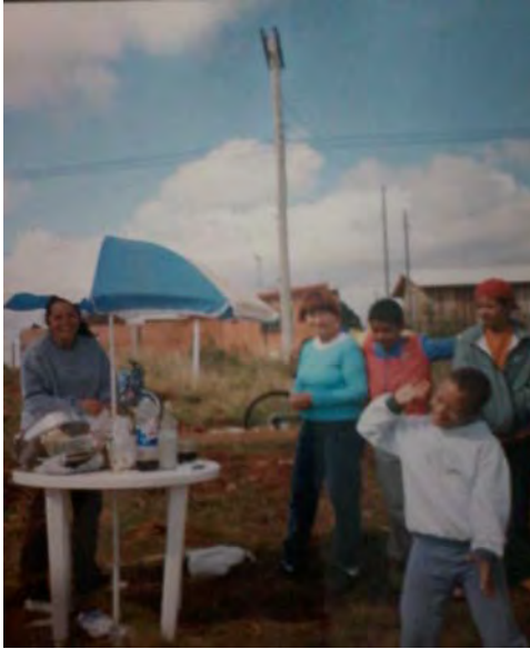
Preparação da festa.