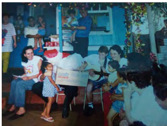
2ª. Projeto natal no ano de 1999.