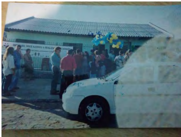
7ª Inauguração da creche 2003