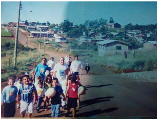
10ª. Passeio UPF (Universidade de Passo Fundo)