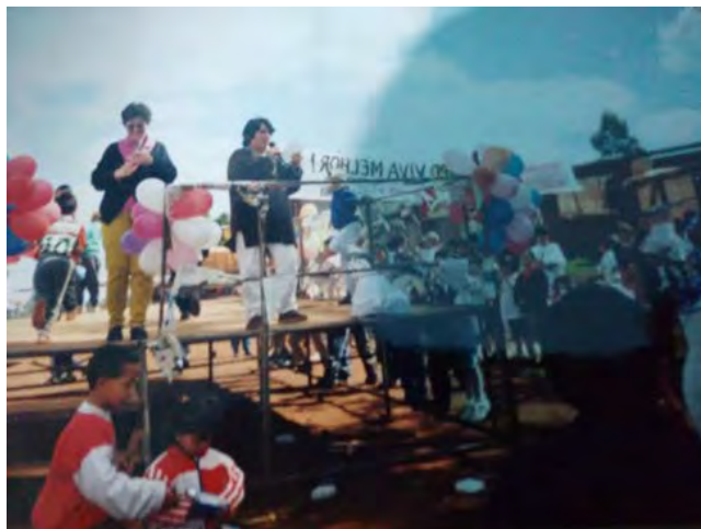
4ª. Festa da criança em 1999