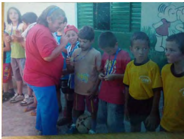
8ª. Escolinha de futebol