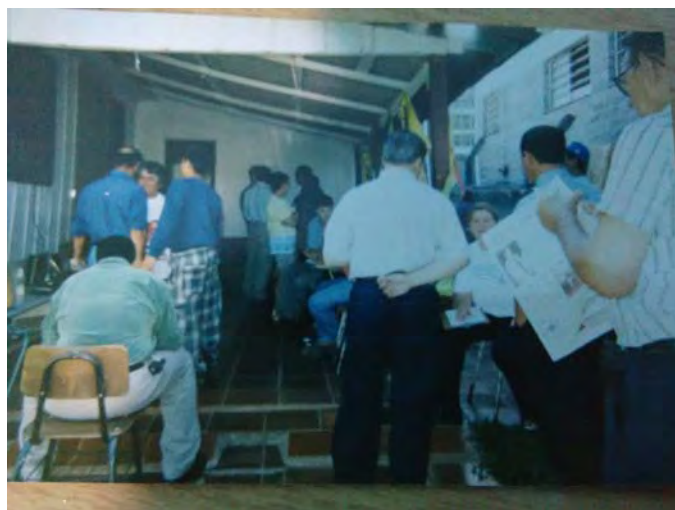
12ª. Saúde bucal