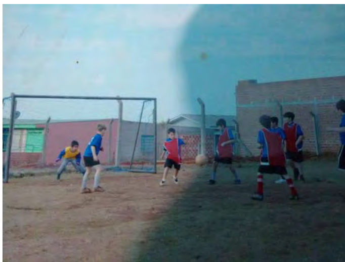
15ª. Jogos infantis