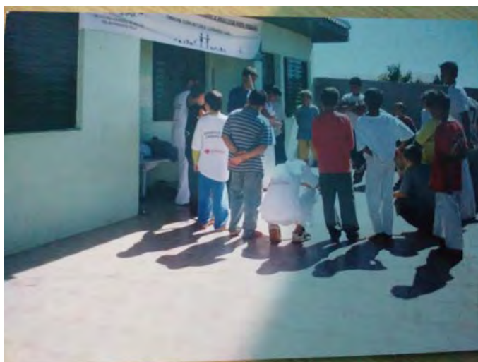
17ª. Grupo de capoeira 2003