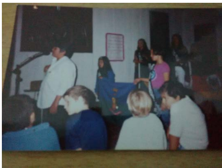
6ª. Biblioteca – 2004 Espaço Cultural Jorge Amado