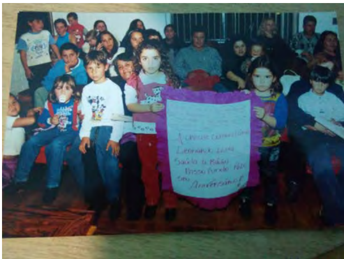
14ª. Aniversário da Rádio Passo Fundo