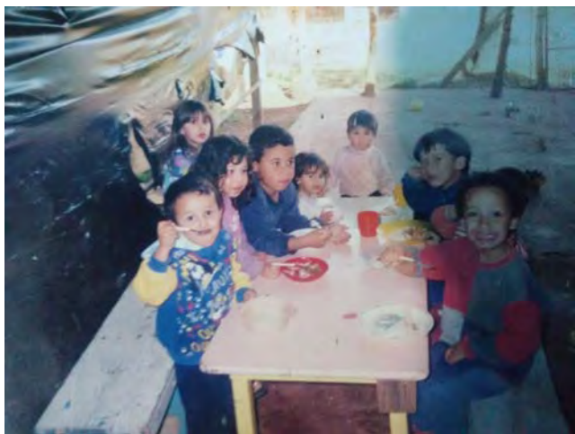
5ª. Casa (creche) Adalzidia Gaspareto.