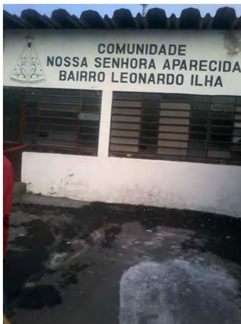
Igreja Nossa Senhora Aparecida

A parte dois, localizada para o lado do rio Miranda, perto de onde está sendo construído o loteamento Canaã, sendo que esta é a parte um, pertencem à comunidade Nossa Senhora Aparecida