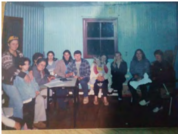
1ª. Reunião para a fundação do grupo de mulheres Unidos Venceremos.