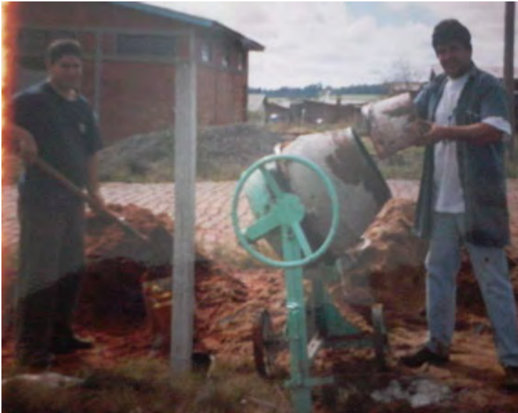
Construção Salão Comunitário