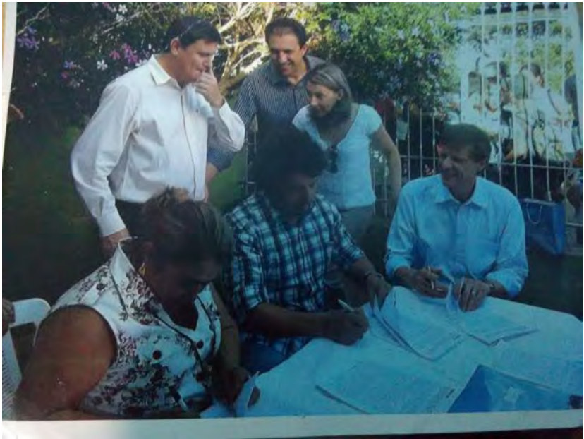
18ª. Assinatura grupo habitacional Canaã