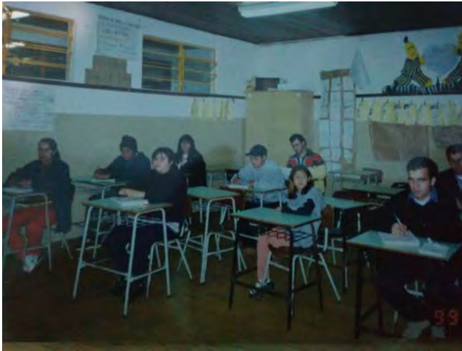
9ª. Turma de alfabetização e preparação para o supletivo 2001