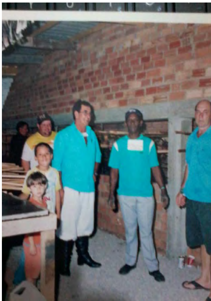
Festa para construção igreja